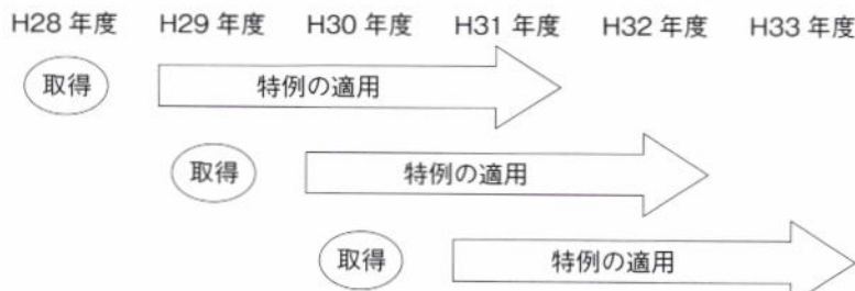
図表 1 固定資産税の特例措置の適用イメージ

(※例) 平成28年に新たに取得した設備は、平成29年1月1日時点で所有する資産として申告され、平成29、30、31年度の3年間固定資産税が軽減されることとなります。